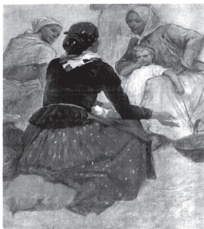
7. ábra. Deák-Ébner Lajos: Kofák, é. n.