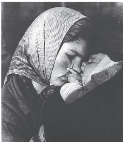
1/b. ábra. Escher Károly: Proletár Madonna (Éhes a baba), 1938

s miként Escher vallja saját műveiről, úgy e festményről is elmondhatjuk: vádiratok ezek „a lelkiismeretlen emberek és a felelőtlen társadalom ellen” (Albertini, 2002). A gyermek ugyanakkor mindkét idézett képen a féltő anyai szeretet eleven tárgyaként jelenik meg, akit anyja a jövő zálogaként dédelget, őriz.