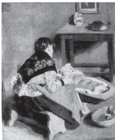
3. ábra. Fényes Adolf: Bölcsőt ringató, 1907