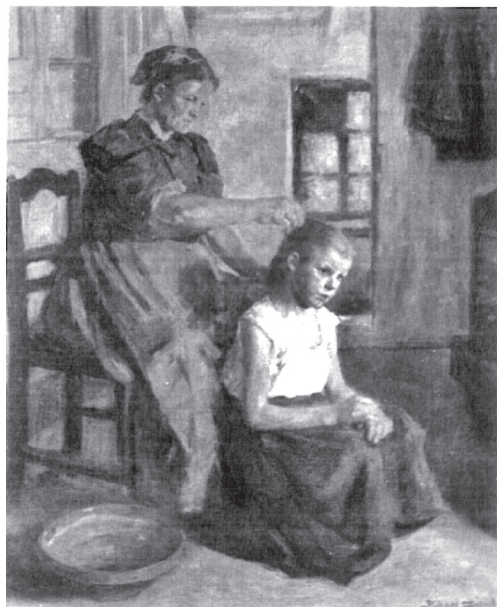
6. ábra. Bihari Sándor: Gyermekét fésülő asszony , 1905

Bihari e művén immár – a régebbi barnákkal és élettelen helyi színekkel