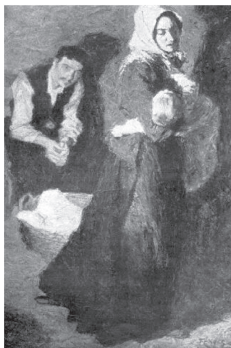
1/a. ábra. Fényes Adolf: Család, 1898