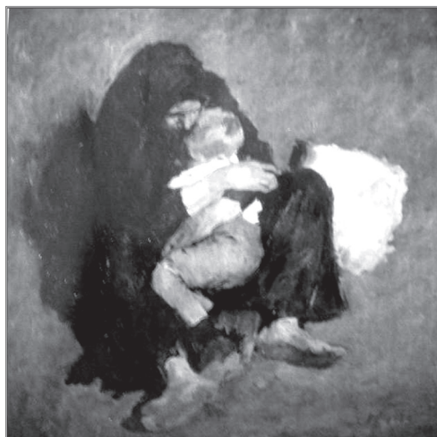
2. ábra. Fényes Adolf: Anya, 1901

Ugyancsak a szegényember-korszakból való az Anyá című kompozíció (1901; 2. ábra), amelyen egy öt-hat éves, jól öltözött fiúgyermeket látunk sötét ruhás, mezítlábas anyjának testébe kapaszkodva. Az asszony féltve és oltalmazón ragadja magához gyermekét. Az anya megviselt lába, görnyedt testtartása megtört lényére utal, ezzel szemben fián még cipő is van; ez okot adhat többek között arra a találgatásra, hogy az asszony módosabb örökbefogadóktól kapta vissza az „övét”. A gyermek fehér alakja az ártatlanság alakjaként tűnik ki az anya baljóslatú feketéjéből, kettejük alakja mégis összetartozónak érződik a mozdulatok bensőségesége, drámaisága okán. A képből egyszerre árad a gyötrő szegénység és az egymásra utalt-