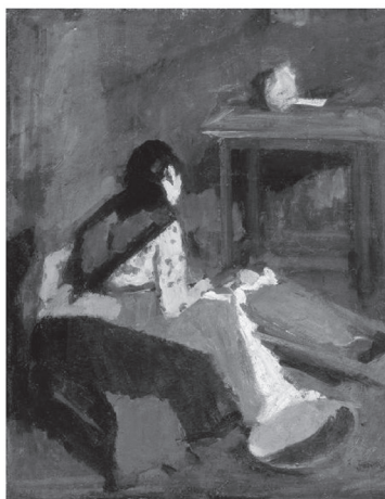
4. ábra. Bölcsőt ringató, 1902

ság atmoszférája, anya és gyermeke egymással szorosan összefonódó alakját „a nehéz mindennapok egyetlen fénye, az összetartozás járja át” (Oelmacher, 1970, 25. o.). A két alakot semleges térben látjuk, ezzel is megalapozva a kép passzív, meditatív jellegét, kritikai attitűdje révén azonban kifejeződésre jut a művész nagyfokú szociális érzékenysége, embersége is. A képből halk szavúan, de megrázóan árad az egymásra utaltság és a nélkülözés légköre (Oelmacher, 1970, 25. o.). A festmény alapvető koncepciója, ha tetszik, szintén az a törekvés, mellyel a művész érzékeltetni kívánja a szeretet roppant integráló erejét az életkörülmények könyörtelenségével szemben.