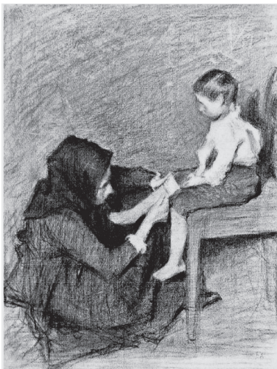
5. ábra. Fényes Adolf: Öltöztetés , 1903 k.

Öltöztetés című rajzán (1903; 5. ábra) a művész anya és gyermeke kapcsolatából ragad ki egy szótalán pillanatot. Az asszony a földön ül, onnan igazítja széken ülő kisfián a nadrágot – talán templomba vagy iskolába készül engedni gyermekét. A gyerek állapota sokat elárul a családról, így nem engedheti utcára gondatlanul felöltözve – a gyermek az anya számára akkor büszkeség, ha a falubelieknek elnyeri szívbeli tetszését. A paraszti közösségekben az erkölcsi megítélés szorosan összefonódott a külsőségekkel, ezért az ember fia nem feledkezhetett el magáról egy pillanatra sem. Ugyanakkor nem érződik kényszerűség a jelenetből: a gondoskodás és a szeretet ereje nyilvánul meg ebben a bensőséges, rituális törődésben, kettejük alakját afféle mértéktartó szeretet köti össze. A gyermek lényéből alázat érződik anyja iránt.