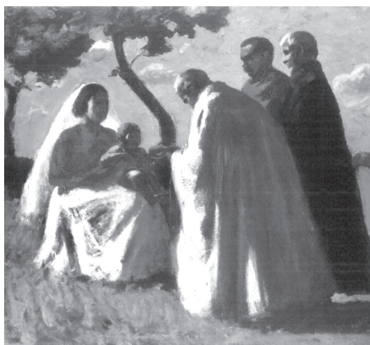
10. ábra. Koszta József: Háromkirályok („Paraszt Madonna”), 1906–1907

reá néz, mintegy az ártatlanság fátylával takarja el a gyermekkor valóságát. A képen hangsúlyos Madona-áthallást érzünk. Szemtanúi lehetünk a gondoskodó, oltalmazó anya képének: a képen a kiolthatatlan archaikus szeretet érződik, akadémikus megoldásokkal, korántsem objektív-leíró jelleggel; a teknő sem a részletező elbeszélés kedvéért szerepel a képen, sokkal inkább az anyaszerep nélkülözhetetlen tartozékaként. E képen mintegy afféle művi anyaideállal találkozunk.