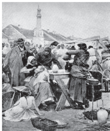
8. ábra. Deák-Ébner Lajos: Lacikonyha, 1904

ösztönös meghatározója az ember életének, s ez minden korban állandó (Pollock, 1998, 176–194. o.).