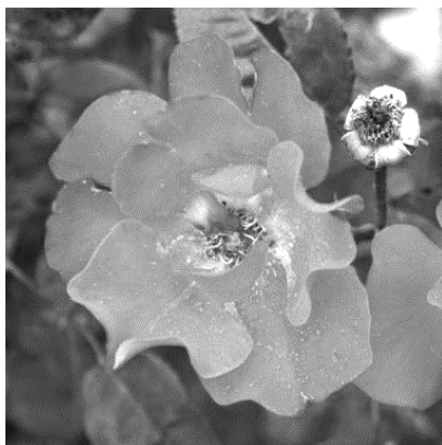
1. ábra. József Attila Emléke – Floribunda Rózsa. Forrás: József Attila Emléke Floribunda rózsza. Nemesítő: Márk Gergely (1997), színe: világos meggypiros virág: 7 cm, erősen telt. Leírás: 60-70 cm magas, mérsékelten szétterülő bokor. Lombozata sötétzöld, levele középnagy, fényes. Betegségekkel szemben toleráns.