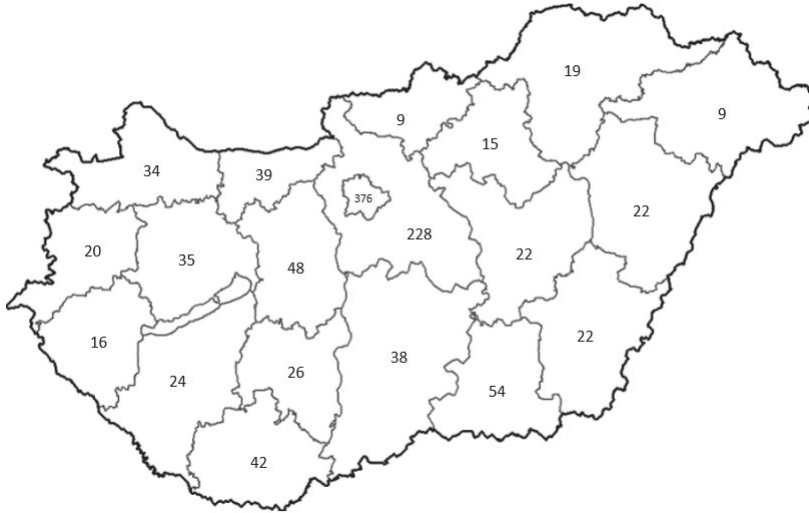
1. ábra. Tiltakozó intézmények száma megyénként

A tanári akciók országos elterjedése a ckpinfo.hu 10 adatai alapján az 1. ábrán látható.