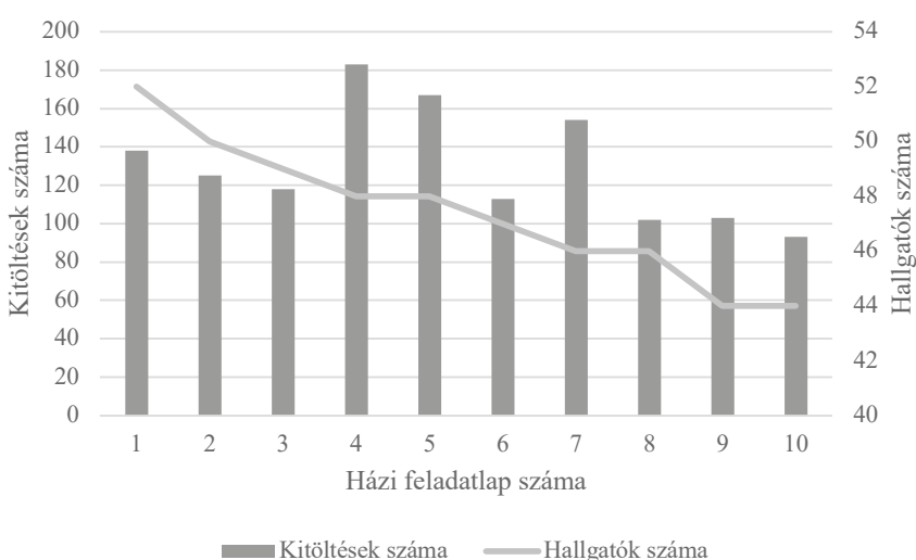
1. ábra. Az egyes házi feladatlapok kitöltési számainak alakulása az őket kitöltő hallgatók számával kiegészítve

Az utolsó kutatási kérdés arra irányult, milyen tendenciák rajzolódnak ki a hallgatói otthoni munkavégzésről, amelyek oktatóként összetettebb bepillantást engednek az önjavító házi feladatlapok online környezetéből letölthető adatok összesítésével (ld. 1. ábra). Ezen adatok nemcsak az otthoni munkavégzésbe engednek bepillantást, hanem szervesen hozzájárulhatnak a feladatlapok, ezáltal a kurzus továbbfejlesztéséhez is.