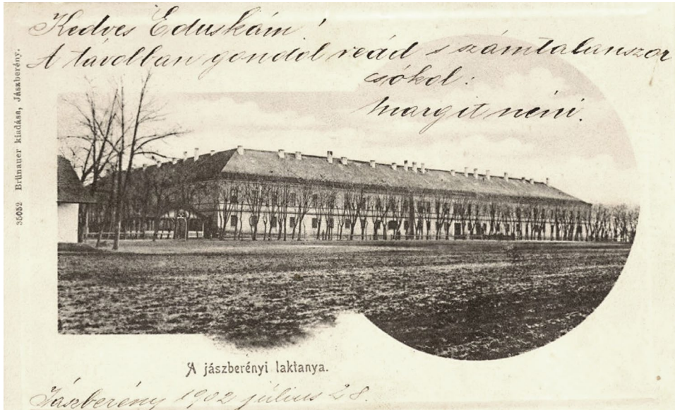
4. kép: A gyilkosság helyszíne: a jászberényi huszárlaktanya régi képeslapon