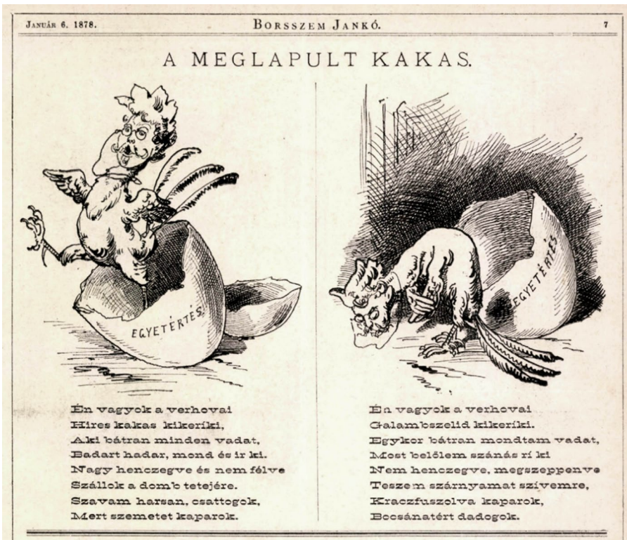
6. kép: A Borsszem Jankó karikatúrája, amelyet Tóth Ferenc személyes sértésnek értelmezett (Borsszem Jankó, XI. évf. [1878] 522. [1.] sz. 7.)

ugyanis, hogy Tóth a szülőfalujában, Tiszaigaron nősülni szándékozott, és e célból az előző év végén haza is utazott, ám elkésett: a lány időközben máshoz ment férjhez. A kikoszarás érzékenyen érintette a már nem éppen fiatal hadnagyot, ráadásul állítása alapján visszatértek Szapáry az egész tisztikar előtt megszégyenítette: a Borsszem Jankó élclap 1877. évi utolsó, 521. számában, 32 a „Mokány Berczi” című rovatban olvasható – többek között – egy mondat („Rosz bika jaz, ki egy tehénért odahagyja a csordát!” 33 ), amelyről Tóthnak meggyőződése volt, hogy az Szapáry műve, és rá értette. „Hogy pedig e cikket csakugyan gróf Szapáry Imre közölte, ezt onnét tudom, mivel gr. Szapáry Imre százados ur volt az, ki engem még e Borsszem Jankóra figyelmeztetett is. Ezután a »Borsszem Jankó« majd minden számában neveltségessé tett engem, különösen emlékszem egy közleményre, mely két rajzzal volt ellátva, s mindkét rajzon e szavak voltak »Egytértés.«” A tárgyaláson egyértelművé vált, hogy Tóth Ferenc feltételezései az élclapban megjelent tartalmakkal kapcsolatban alaptalanok voltak. 34