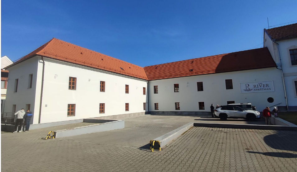
8. kép: A bíróság mögött lévő, egykori börtön udvara: itt állt a bitófa 1878. március 2-án