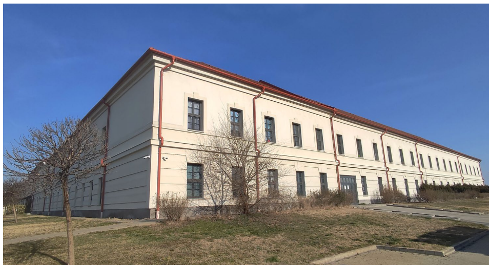
5. kép: Az egykori laktanya napjainkban, amely Jász-Nagykun-Szolnok vármegye legnagyobb alapterületű épületkomplexuma – jelenleg óvoda működik a falai között, valamint szociálisan rászorulóknak részére is biztosít lakhatást (a szerző felvétele, 2025. március 8.)